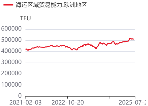
图4：亚欧航线集装箱船运力