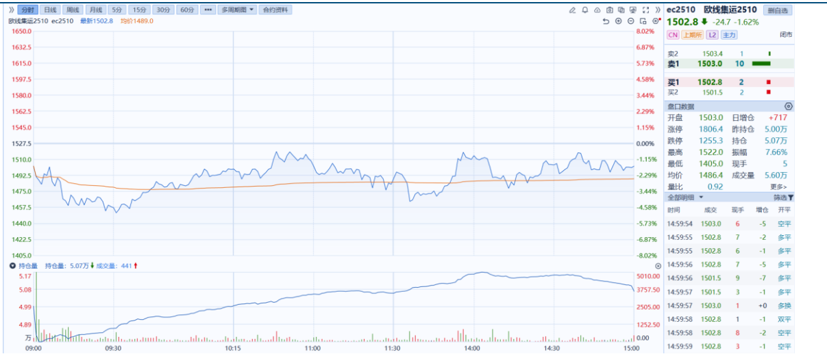
图1：主力合约日K线图