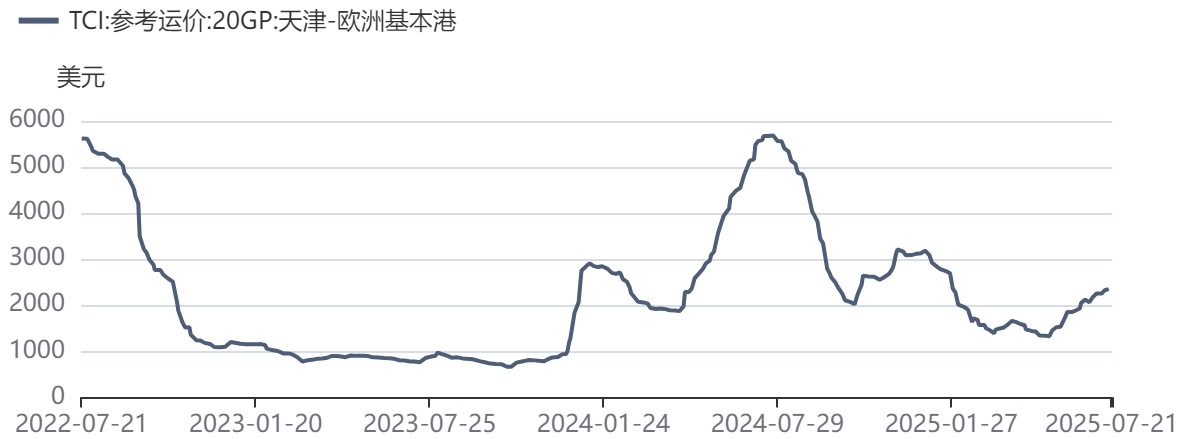
图2：TCI：天津→欧洲日度运价