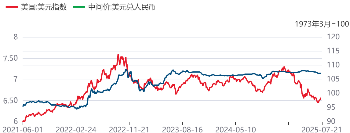
图7：人民币兑美元汇率及美元指数