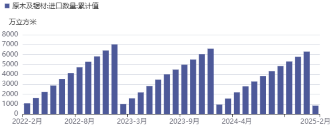
图3：原木及锯材：进口数量：累计值

2025年3月17日-3月23日，第12周18港针叶原木预计到船17条，较上周减少9条，周环比减少35%；到港总量约41.46万方，较上周减少20.74万方，周环比减少33%。受中国禁止进口美国原木政策影响，已无北美材到港。2025年1-2月，中国原木及锯材进口量为845万立方米，同比减少11.4%。