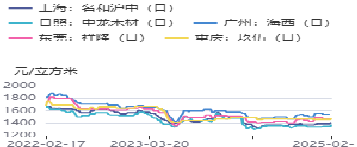
图4：辐射松木方价格：4000*50*100