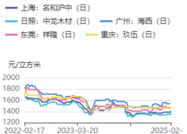
图2：辐射松木方价格：4000*50*100