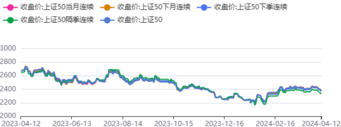
图2：IH合约和上证50指数行情