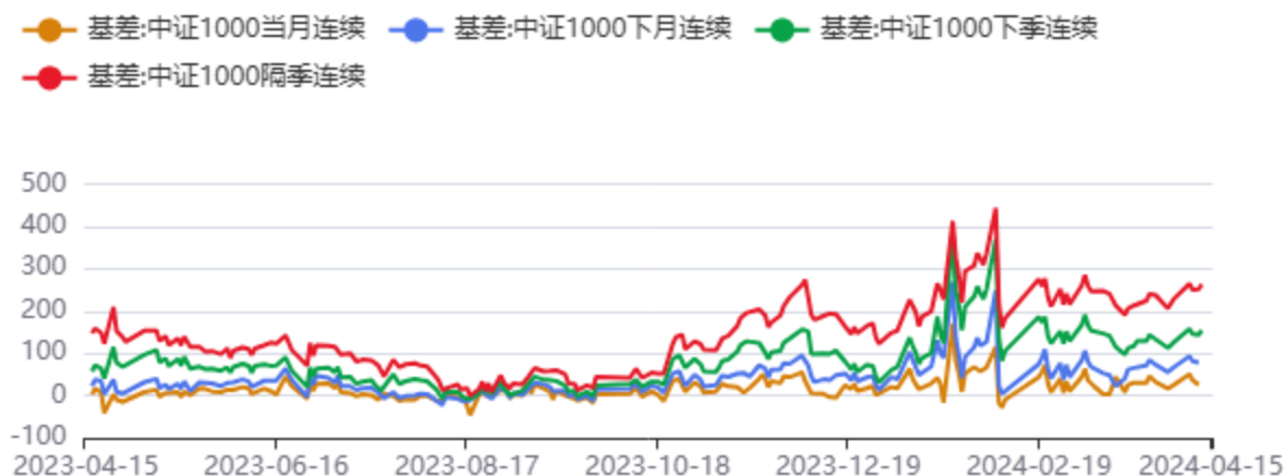
图8：IM合约基差和升贴水