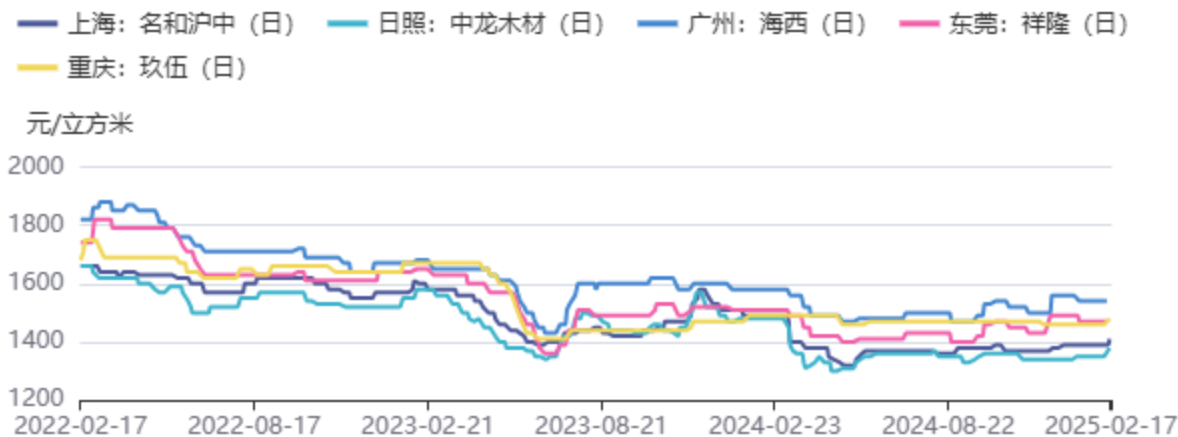
图3：辐射松木方价格：4000*50*100