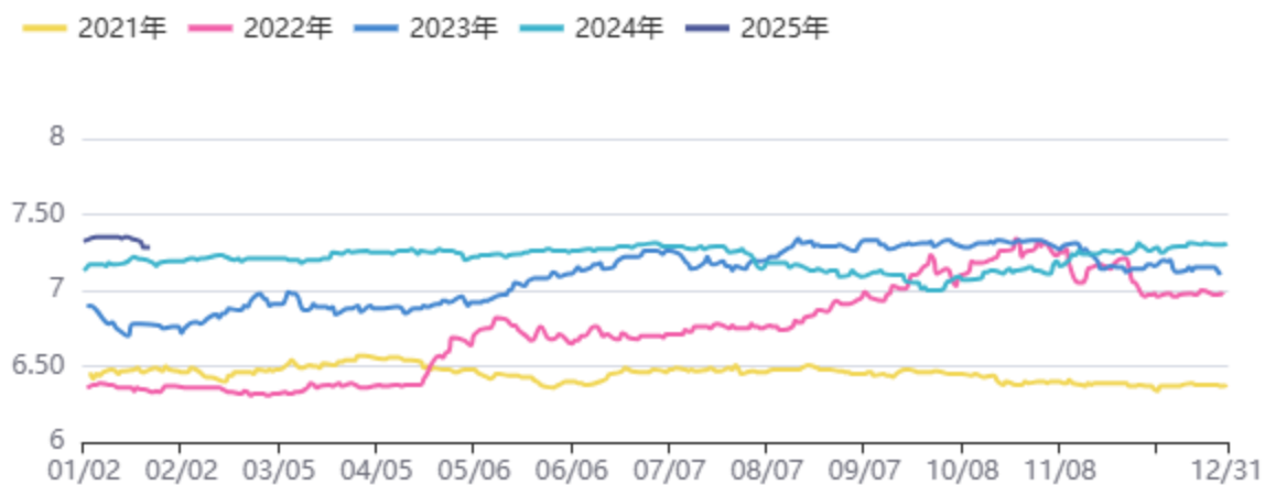
图5：人民币即期汇率：离岸价