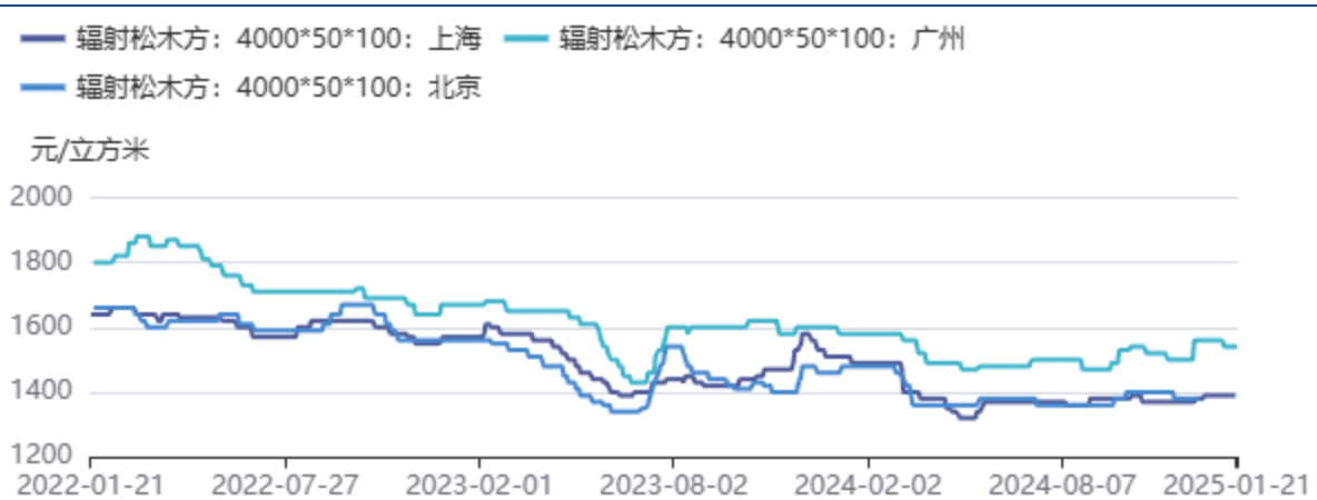
图3：辐射松木方价格