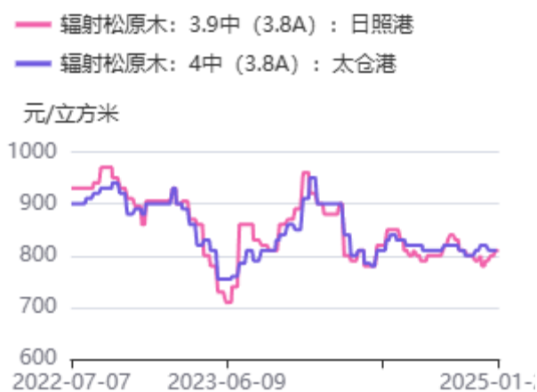
图1：辐射松原木价格