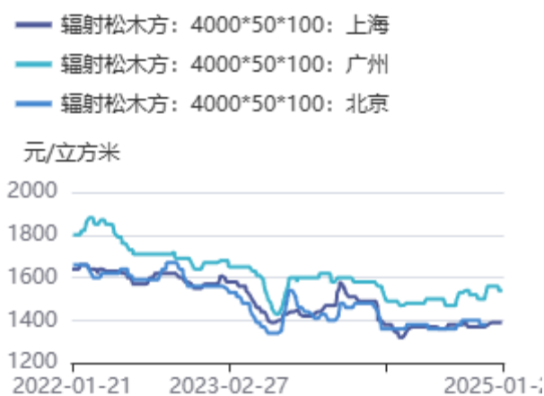
图2：辐射松木方价格