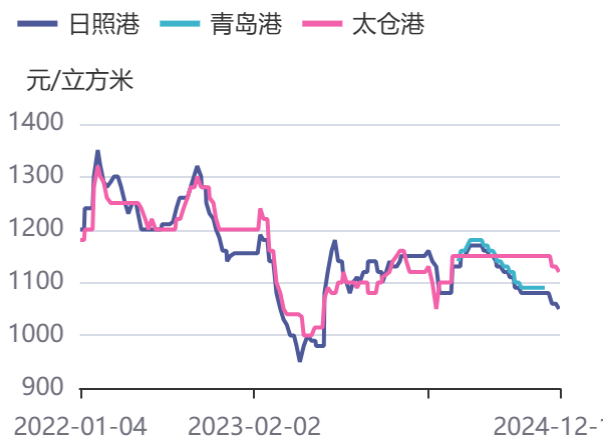
图2：11.8米云杉原木价格