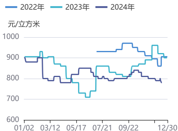
图1：辐射松原木：3.9中（3.8A）：山东：日照港