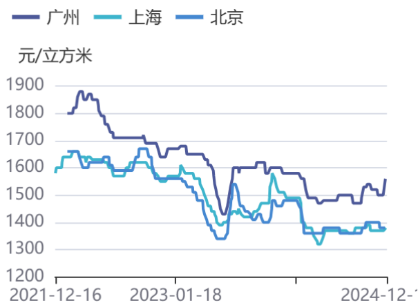
图5：辐射松木方（4000*50*100）价格