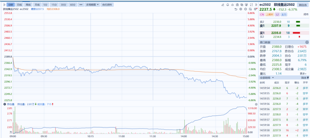
图1：主力合约日K线图