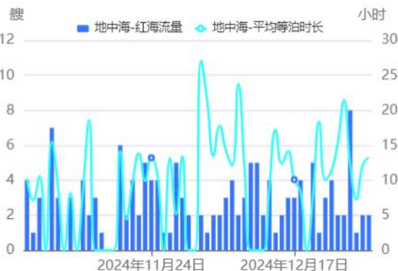
图6：地中海→红海流量/待泊时长