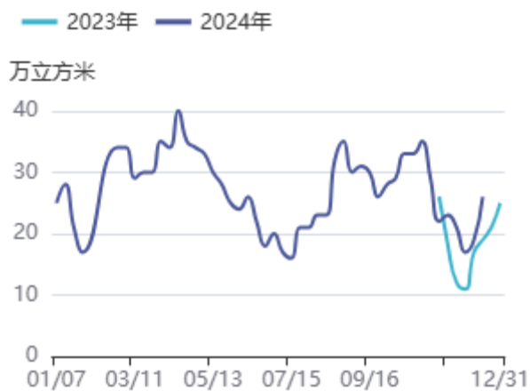
图6：库存:原木:新民洲

国内分材质原木总库存为263万方，较上周减少6万方，周环比减少2.23%；辐射松库存为208万方，较上周减少2万方，周环比减少0.95%；北美材库存为35万方，较上周减少3万方；云杉/冷杉库存为14万方，较上周增加1万方。