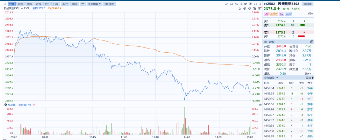
图1：主力合约日K线图