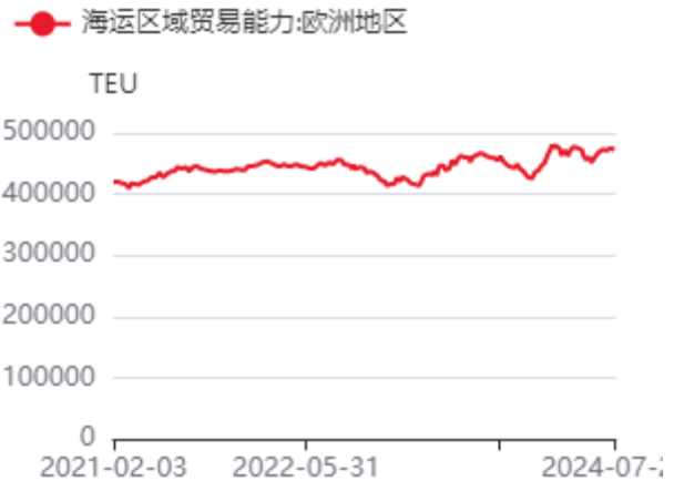
图4：亚欧航线集装箱船运力