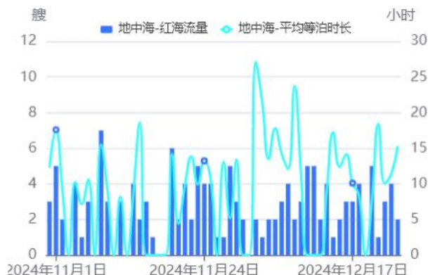
图6：地中海→红海流量/待泊时长