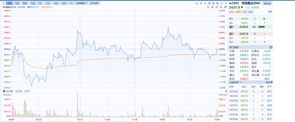
图1：主力合约日K线图