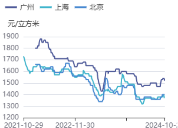
图5：辐射松木方（4000*50*100）价格