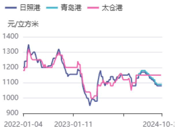
图2：11.8米云杉原木价格