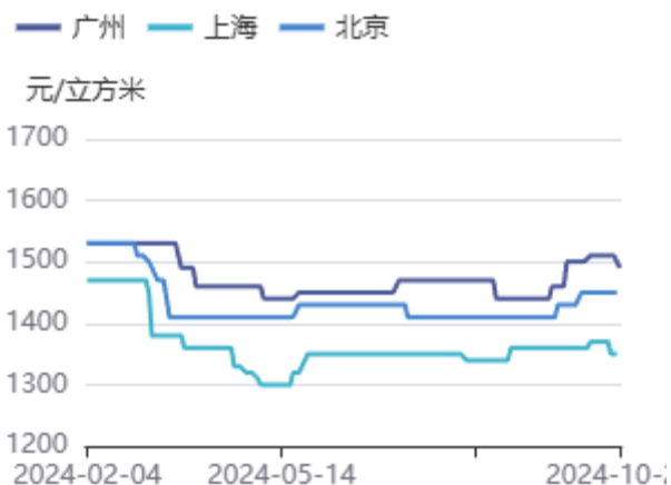
图4：辐射松木方（3000*40*90）价格