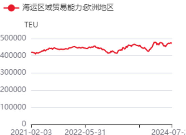
图4：亚欧航线集装箱船运力