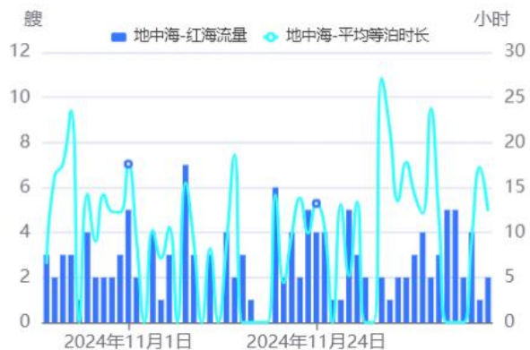
图6：地中海→红海流量/待泊时长