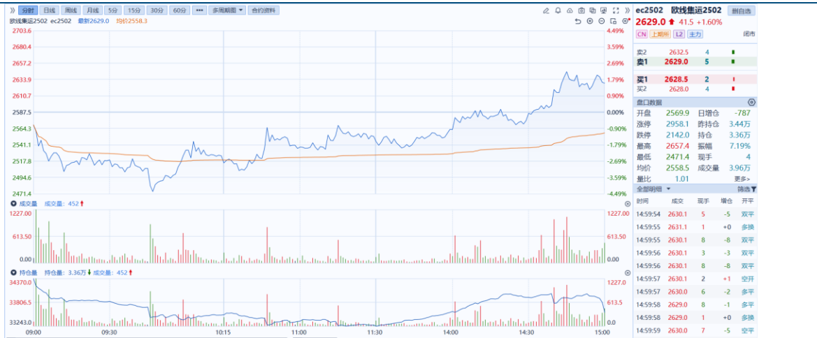
图1：主力合约日K线图