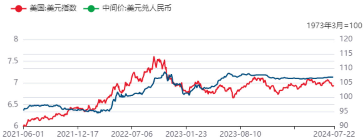
图8：人民币兑美元汇率及美元指数