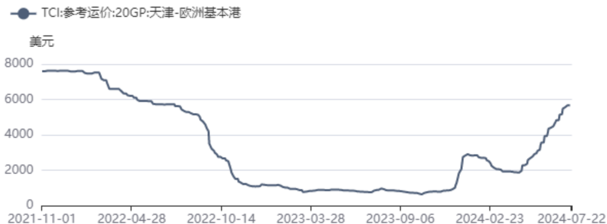
图2：TCI：天津→欧洲日度运价