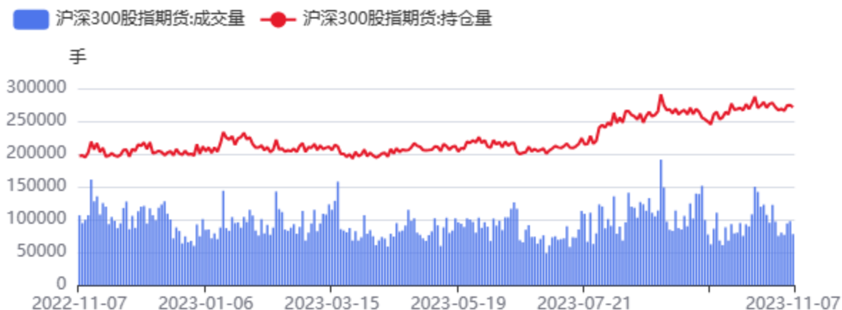
图13：IF合约成交、持仓情况