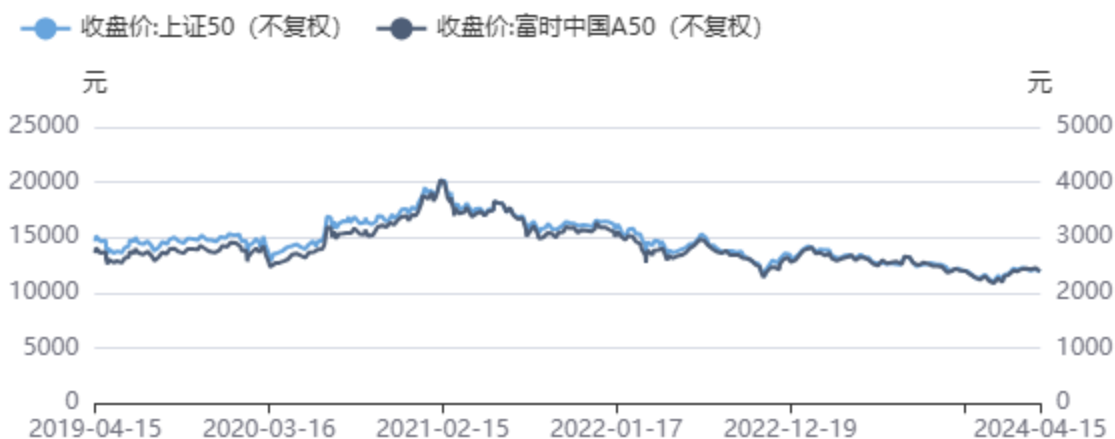
图17：外盘相关品种（A50指数）价格