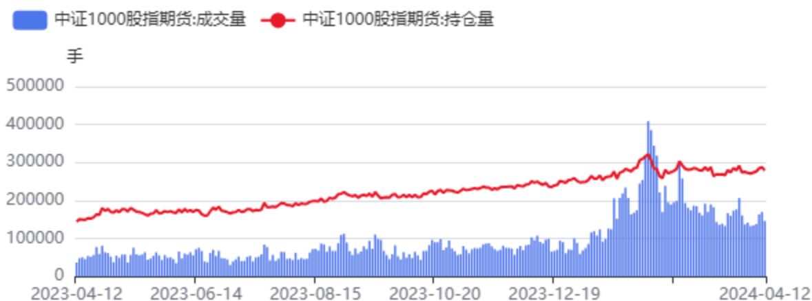
图16：IM合约成交、持仓情况