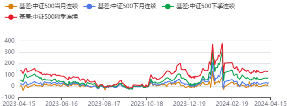
图7：IC合约基差和升贴水