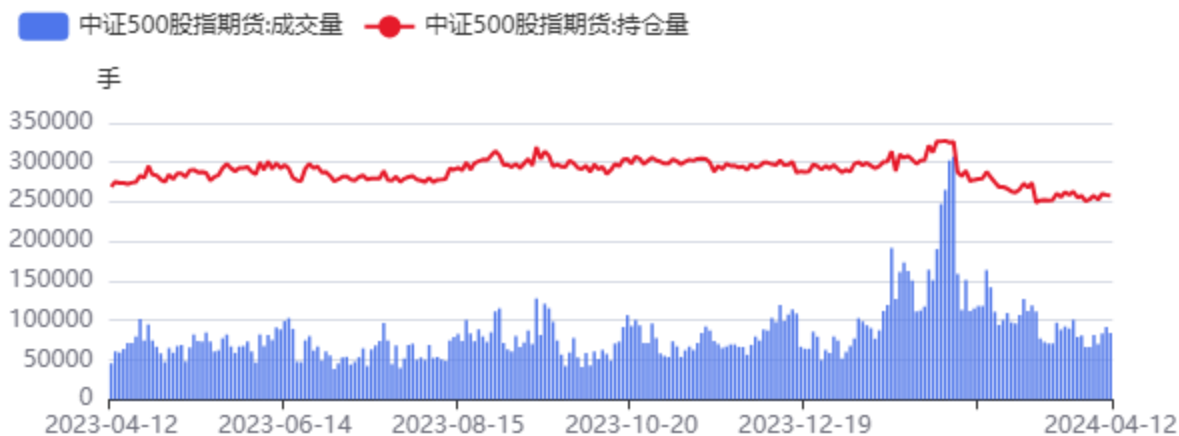
图15：IC合约成交、持仓情况