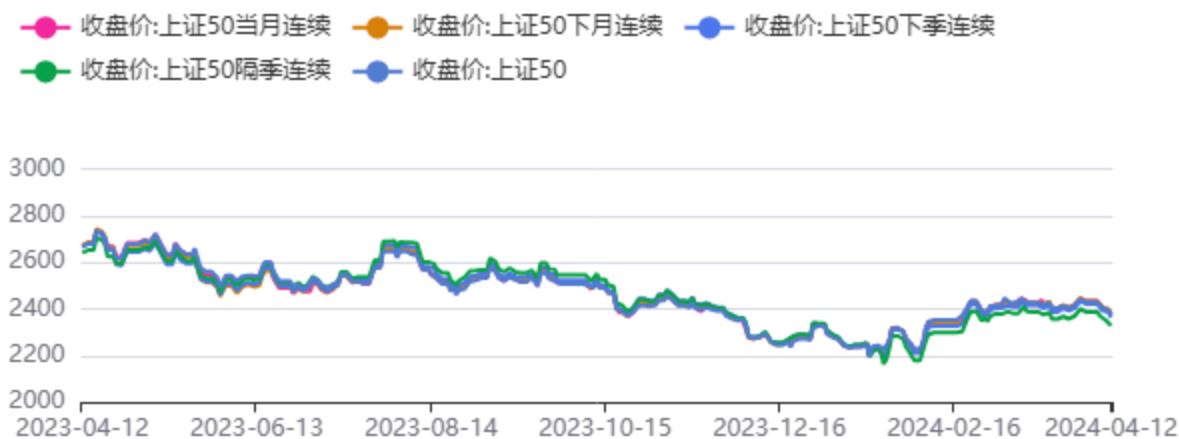
图2：IH合约和上证50指数行情