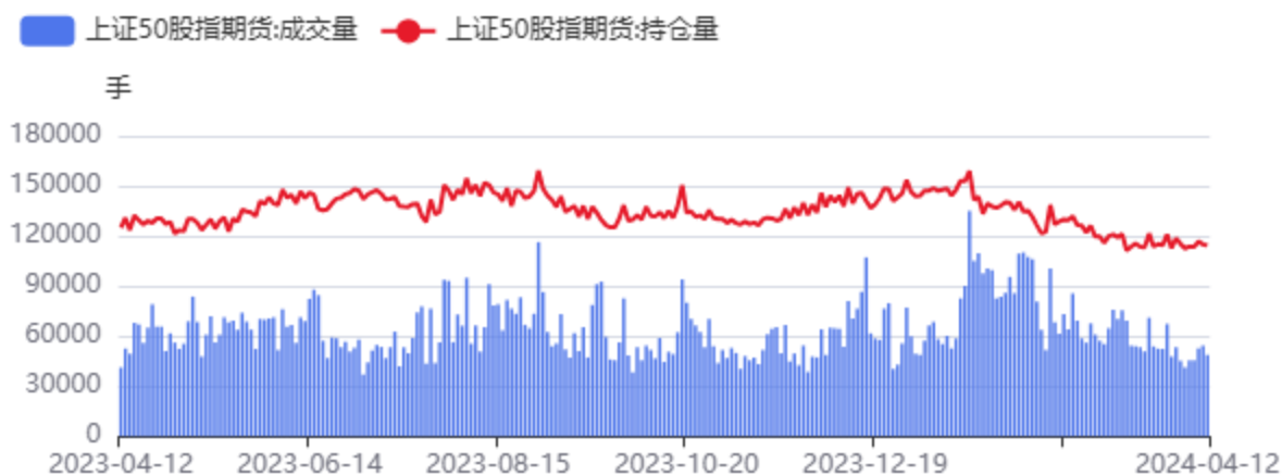
图14：IH合约成交、持仓情况