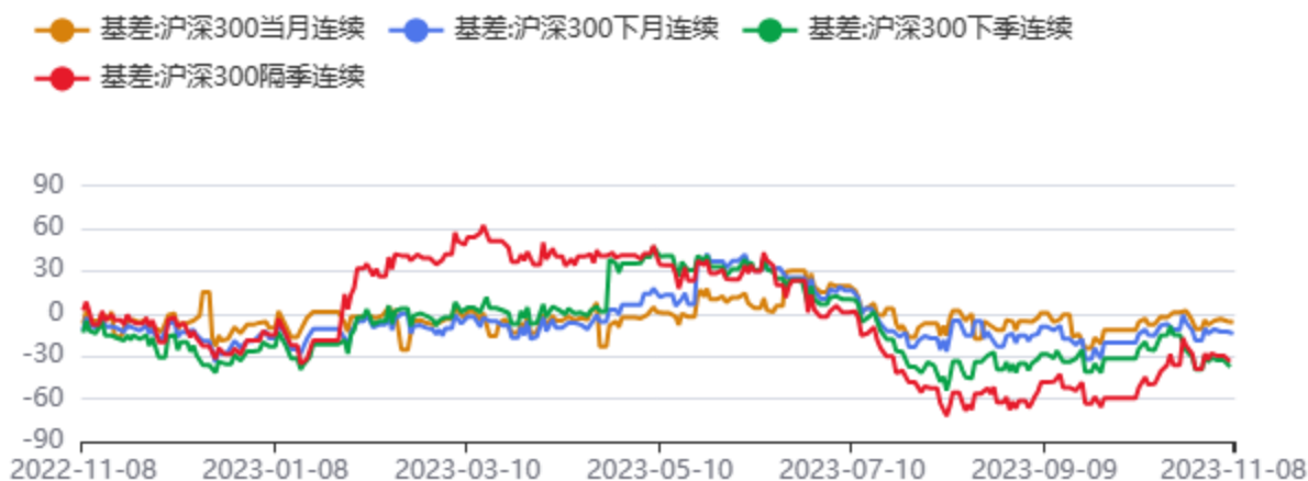
图5：IF合约基差和升贴水