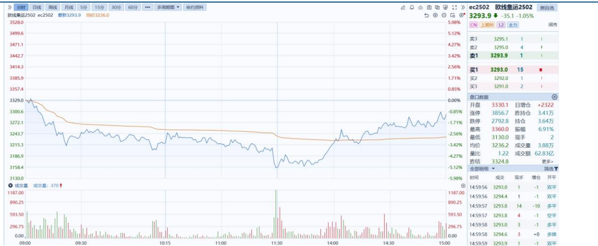
图1：主力合约日K线图